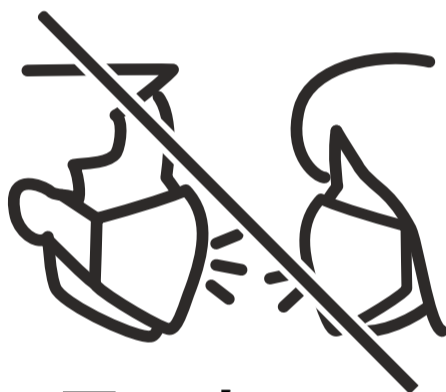
展示室では おしずかに