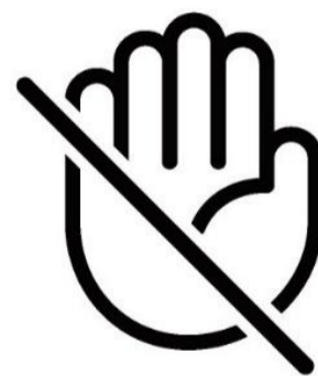
ケース・壁に さわらない